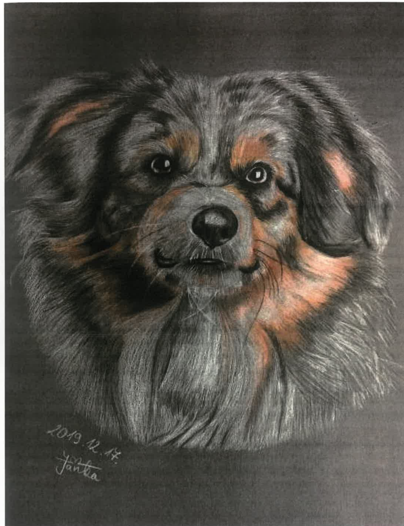
Horváth Janka rajza